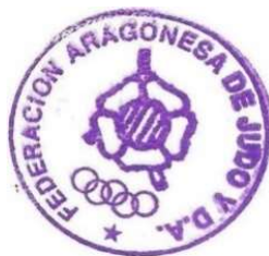
Fdo.- RAÚL CLEMENTE SALVADOR